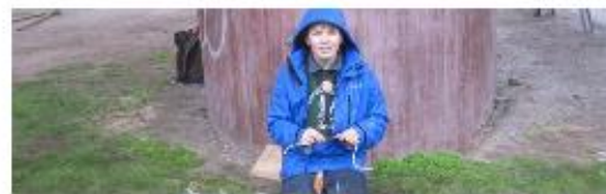
Sidan her leddets 605309 gånger.

(2014-08-12) Snart är det dags igen! Ny termin, nya ledarteam och ny verksamhet som ska planeras. Det gör vi tillsammans på Pettersberg helgen 22-24 augusti. Alla ledarteam, alla utmanare och alla övriga ledare och funktionärer är välkomna ut. Det finns alltid något att göra. Vill du stå i köket och laga god mat åt de planerande ledarna och utmanarna går det bra att ange vid anmälan. Fredag: lättare förtäring och trevlig samvaro Lördag: Gemensam uppstart, planering avdelningsvis, bokning av Pettersberg, gemensamma aktiviteter, god mat, trevlig samvaro Söndag: Fortsatt planering, städning, ev KS (beslutas av tillträdande styrelse den 17 aug) På fredagen är du välkommen ut den tid som passar dig, dock är mätpatrullen där tidigast kl.19. Kommer du på lördagen är det bra om du är där kl. 9.00 för gemensam uppstart (pendeltåg går 07.34 från centralen om du åker kommunalt till Västerby skola). Välkommen! Till anmälan