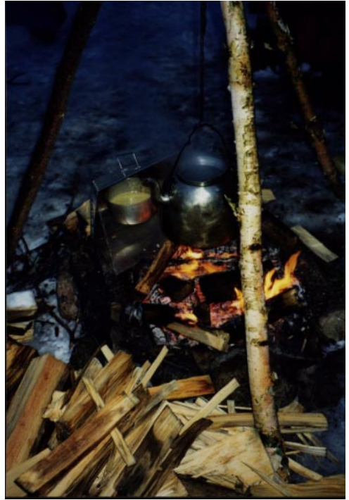
Håll grytan kokande