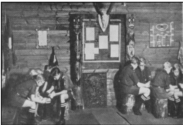
Instruktion i Stugan på Rehnsgatan 16.