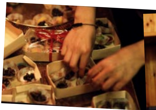
Godislådorna till basaren får cellofan och rött band.

ledare, förklarar för dem att det här mötet ska ägnas åt att göra klart gottislådorna till basaren, instruktion i tag-