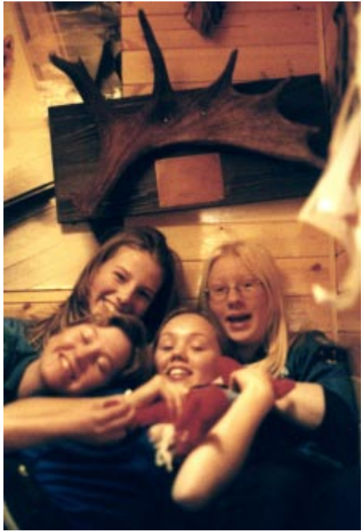
Fniss, hi, hi, hi...

Patrull Räven efterlyser mer variation i programmet. "Det borde finnas annat vi kan göra än lek, instruktion, tävling varje möte" tycker några. En annan berättar om vad de gör andra kårer och nämner fårtävling som exempel. Smaskens tycker Vasens reporter och lovar att komma på det mötet.