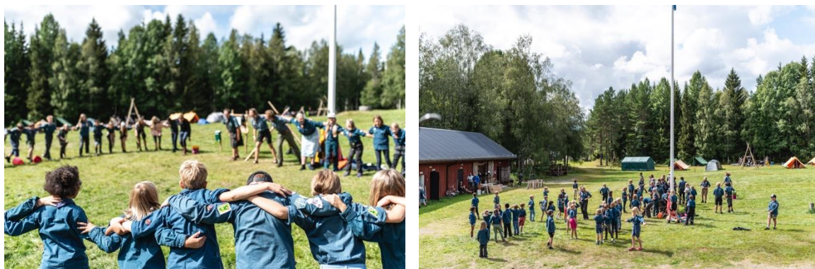
På kårlägret arrangerades grenöverskridande aktiviteter.

År 2019 firade vår scoutkår Gustaf Vasa-Bredäng 95 år, och i vanlig tradition anordnade vi därför ett stort jubileumsläger. Alla kårens grenar och avdelningar deltog på lägret som arrangerades på lägerängarna Skraddartorp i Dalarna. Detta var en ny plats vi aldrig tidigare hade haft läger på.